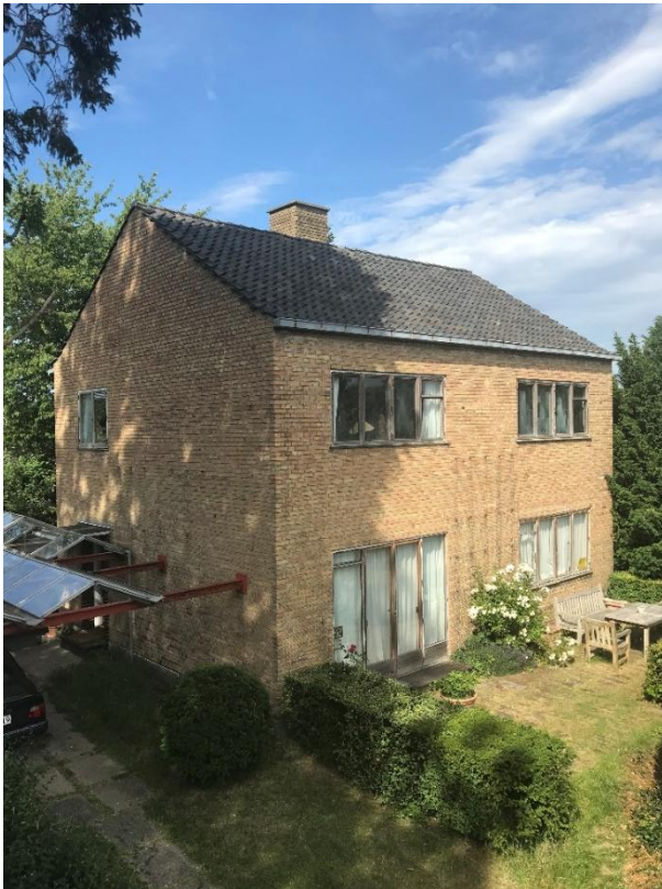
Husets vestvendt gavl og facaden mod syd.