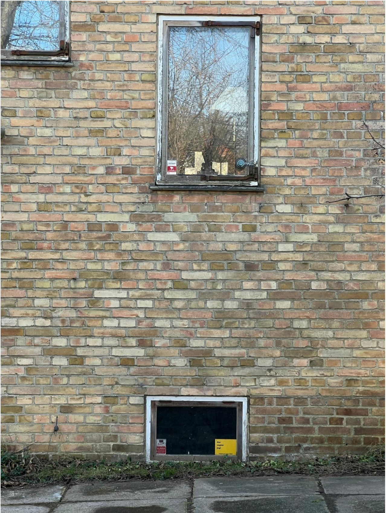
Den gule blankmur af svagt flammede hårdtrændte sten i krydsforbandt med skræbefuge.