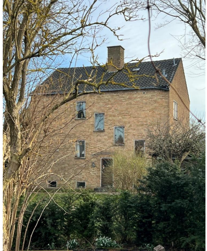
Husets nordvendte facade.