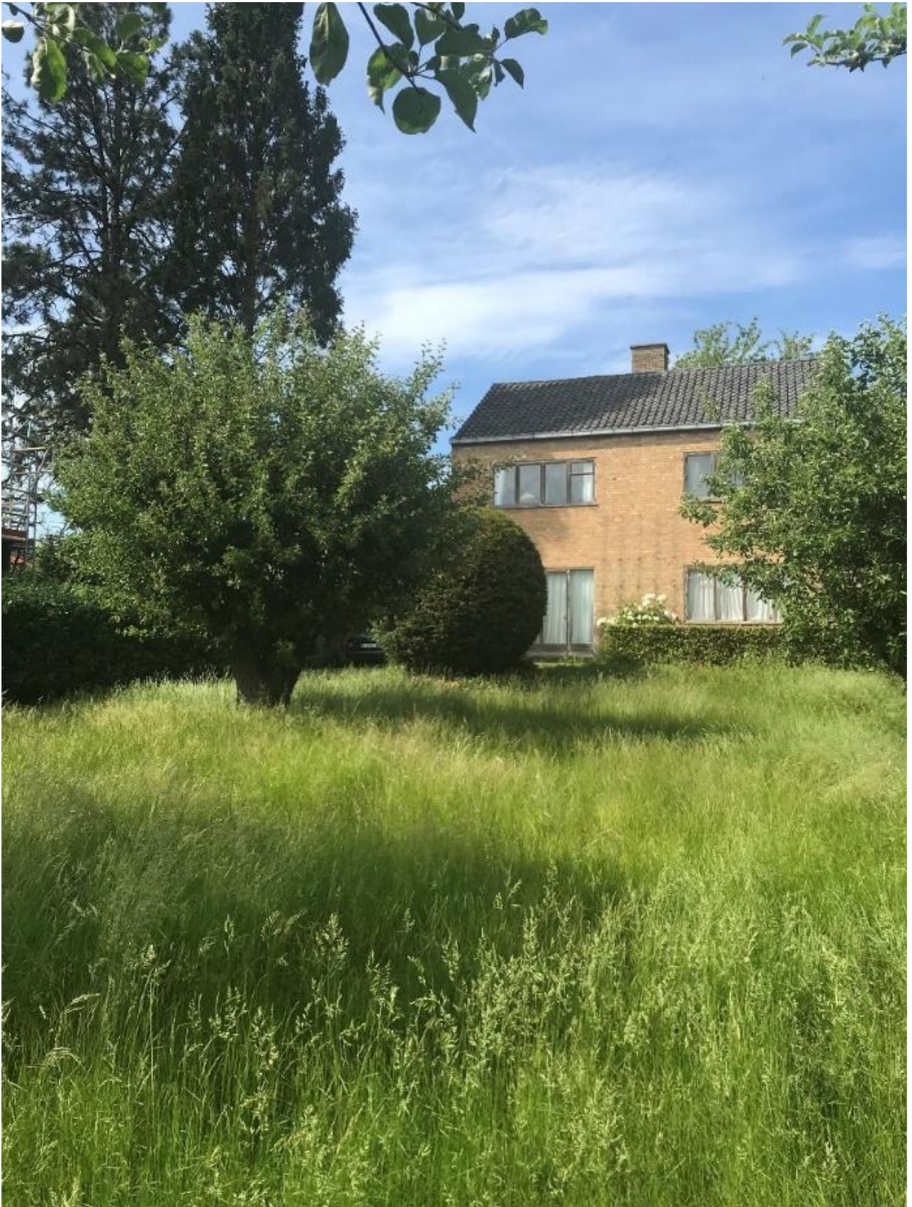
Huset set fra syd gennem den åbne græseng i fuldt flor med nogle af de fritstående æbletræer.