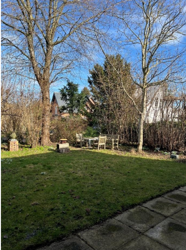
Den nordlige del af haven.