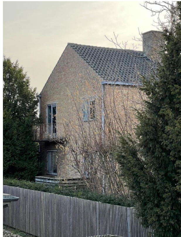
Husets østlige gavl.