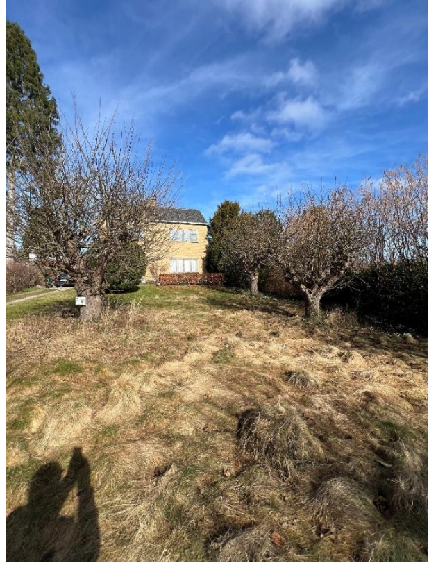
Kig mod husets fra syd med den engrægede have med frugttræer.