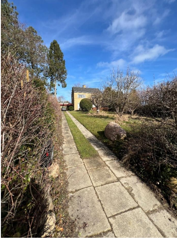
Kig mod husets fra syd med de flisebelagte hjulspor.