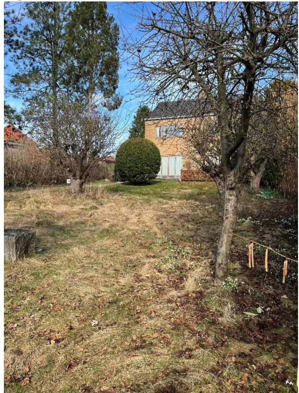
Kig mod husets fra havens sydlige ende.