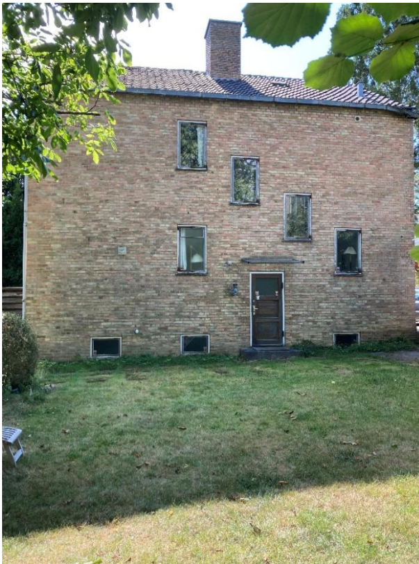
Husets nordvendte facade.