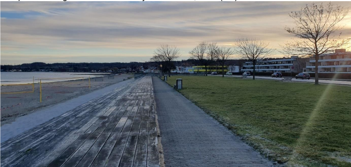
Hotellet og nabo-etagebebyggelserne set fra stranden.