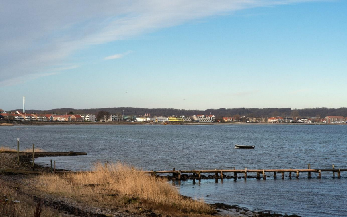
Kystområdet langs Flensborgvej set fra den anden side af fjorden. Hotellet er den gule bygning ca. midt på strækningen. Foto Helene Høyer Mikkelsen, 2022 (CC)