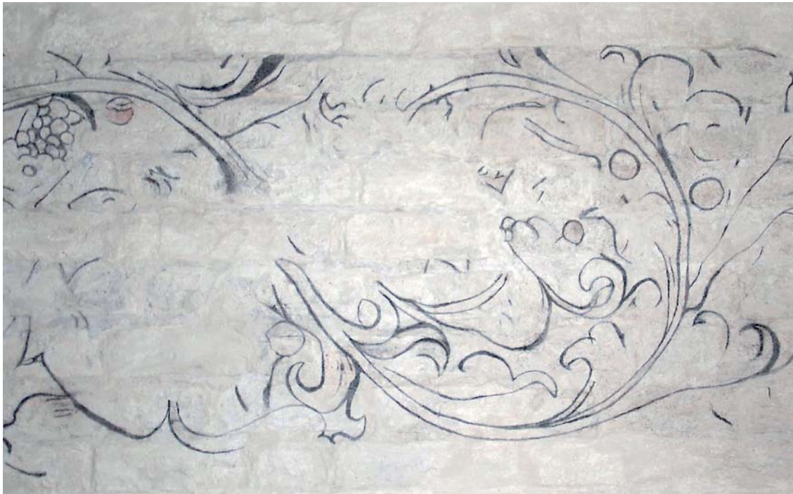
Ved den gennemgribende restaurering af Oddens hovedbygning i 2007-2009 fandt man på en væg på førstesalen i sydfløjen rester af en kalkmaleridekoration fra cirka 1520-1540. Oprindeligt løb dekorationen hele vejen rundt i det dengang 12 meter lange rum som en frise lige under loftet.