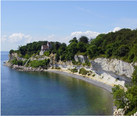
Stevns Klint, verdensnaturarv siden 2014, set mod Højerup gamle kirke.

siteter samt interesseorganisationerne Historiske Huse, Landsforeningen for Bygnings- og Landskabskultur og Organisationen Danske Museer foruden Grønlands selvstyre og Færøernes hjemmestyre, der inviteres til at indsende forslag til tentativlisten.