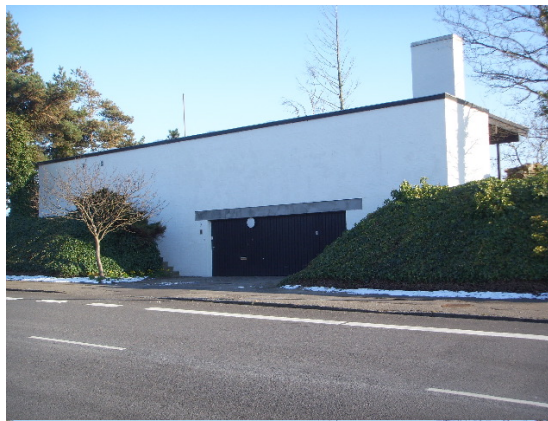
Huset set fra vejsiden – muret / pudset / kalket