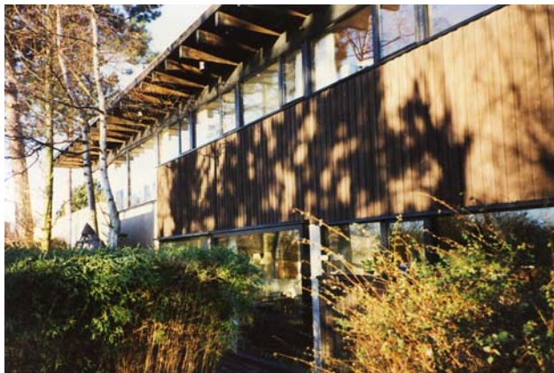
Huset set fra haven - siden med den lette konstruktion