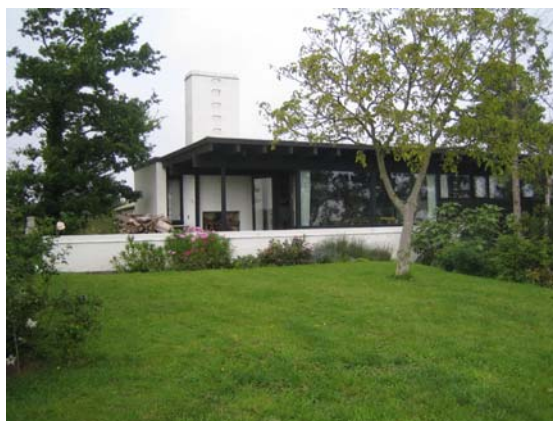
Husets Haveside med den store pejs og skorsten