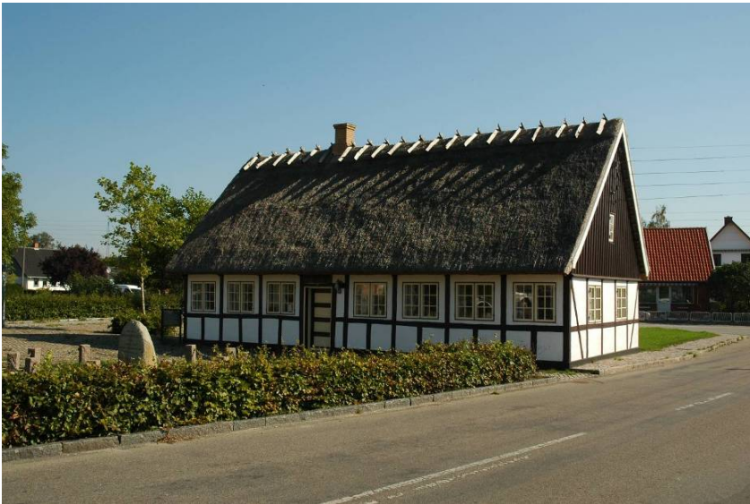
Kommunalhuset i Vålse