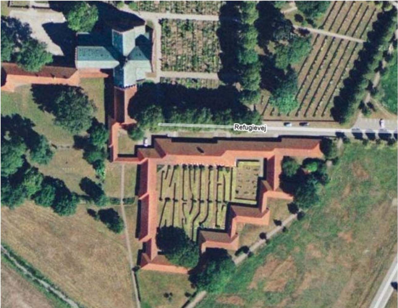
Google earth, haveanlægget omkranset af refugiebygningerne