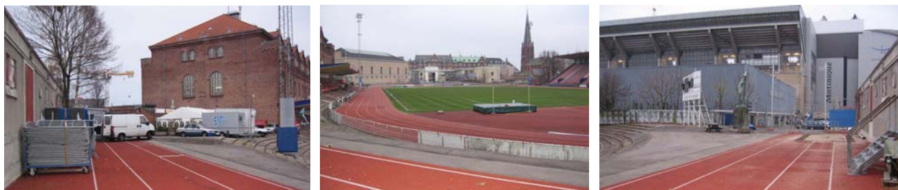
Ill. 8, 9, 10. Vue fra tennishallen og stadion rundt.

På Østre Fælled var der plads til to fodbold- og 23 tennisbaner – alle udendørs. De udendørs baner er siden blevet færre og færre, efterhånden som Østerbro Stadion er blevet udviklet. I dag skulle der være to tilbage, foruden fodboldbane og stadion med tribuner på flere sider.