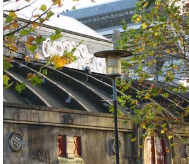
Ill. 2. Vue mod Parken A/S.