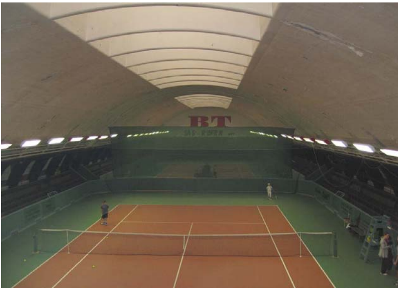
Ill. 4. Tennisbane nærmest indgangen fra klublokalerne.