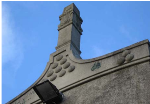
Ill. 12. Den ene af to skorstene, fint detaljeret.