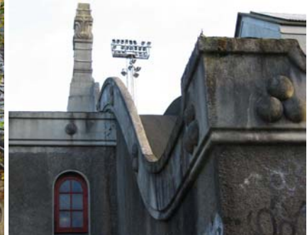
Ill. 3. Gavl mod Idrætshuset.