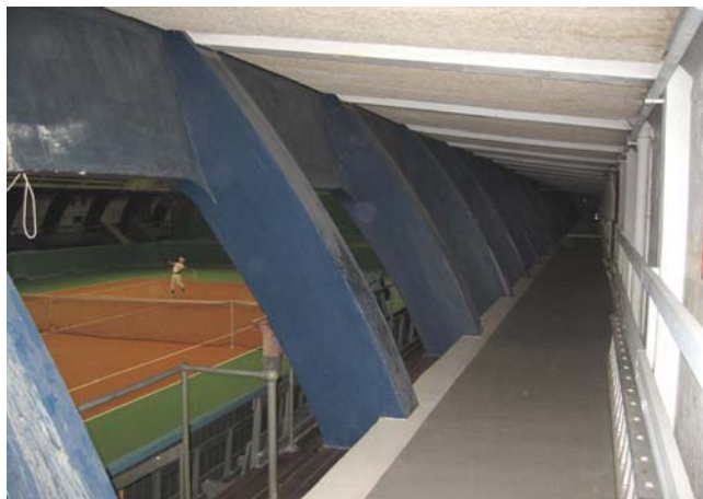
Ill. 13. Ribberne set indefra

Tennishallen fremtræder udendørs snavset og fyldt med graffiti. Både uden- og indendørs er den præget af manglende vedligehold. Dette skyldes dog ikke mangel på entusiasme for bygningen af dens brugere.