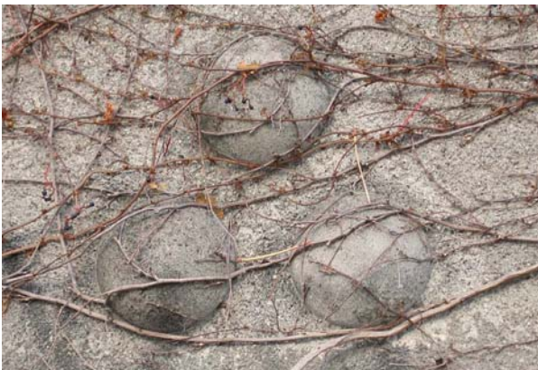
Ill. 11. Nogle af de mange tennisbolde på bygningen.

Tennishallen med de mange fine detaljer i skorstene og murværk, hvor bl.a. utallige tennisbolde, placeret rundt om på bygningens langsider og gavle, fortæller om bygningens funktion samt bærer vidnesbyrd om bygherrerens stolthed. Hallen fremtræder stadig elegant trods tidens hårde tand i form af manglende vedligeholdelse og graffiti.