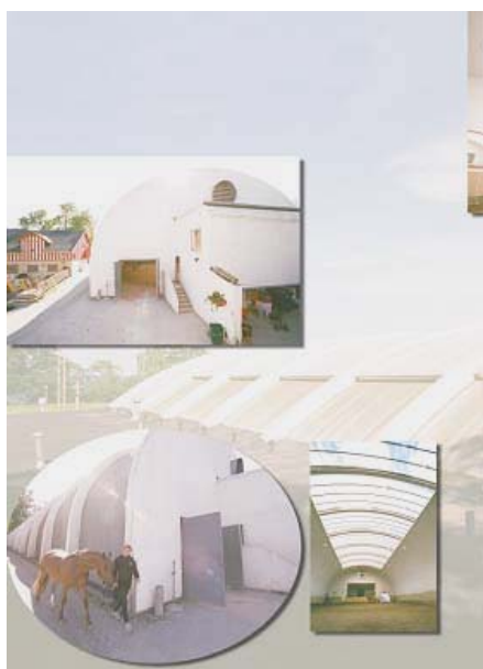
Ill. 6. Mattssons Ridehus, Strandvejen, Klampenborg (1932), ombygget og opført af Arne Jacobsen i jernbeton; den har tidligere været indstillet til fredning.

Af eksisterende bygninger i samme karakteristiske stil med skylight kan nævnes: