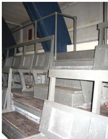
Ill. 14. Udsnit af stolerækkerne, der findes på begge sider af hallen