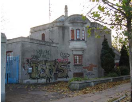
Ill. 1. Bag karnap ligger klublokaler og omklædningsrum. I kælderen har Sparta i dag kontorer.

Gunnar Nu Hansens Plads 11, 2100 København Ø - også Per Henrik Lings Allé 10 (tidl. Idræts Allé)