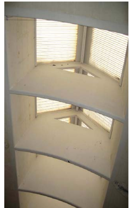
Ill. 5. Skylights.