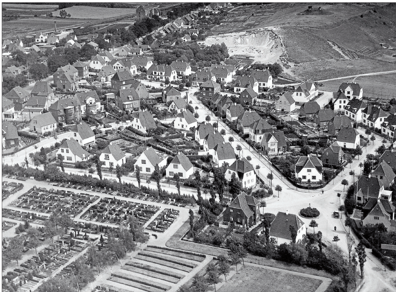
Et historisk billede fra Næstved Museum. Det nye boligområde ved Gallemarksvej og Præstøvej fra første halvdel af sidste århundrede. De første huse blev opført i 1913. Bemærk grusgraven til højre i billedet.

NÆSTVED: Næstved Kommune vil forhindre, at røde tegltage bliver udskiftet med sortglaserede tegl, og at småsprossede vinduer forsvinder.