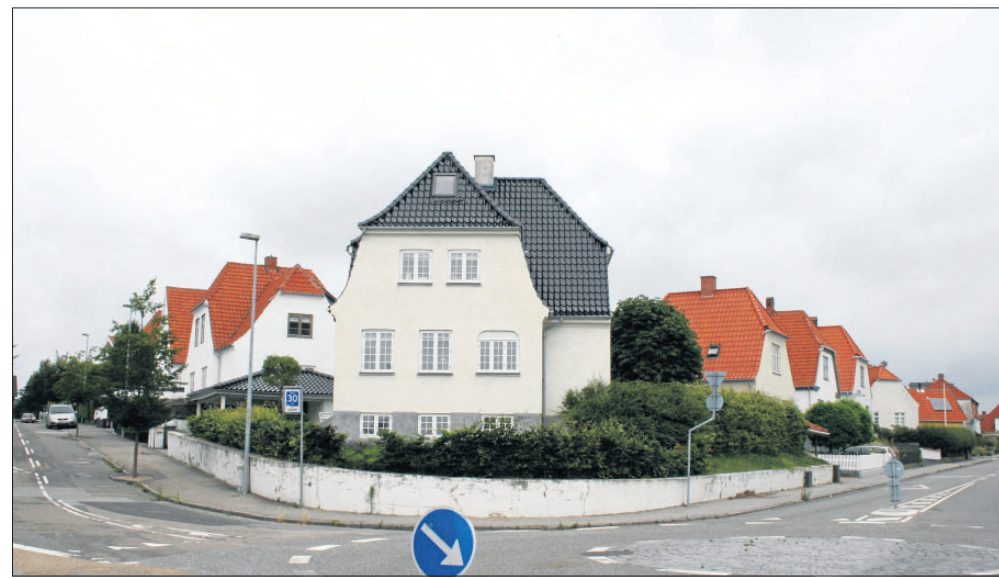
Gallemarksvej og Peder Syvsvej - et bevaringsværdigt område i Næstved.